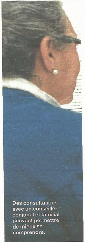
Des consultations avec un conseiller conjugal et familial peuvent permettre de mieux se comprendre.